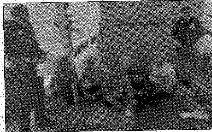
DITAHAN ... Juragan bot berkenaan yang ditahan oleh PPM.

Beliau berkata, bot berkenaan telah dibawa ke jeti PPM Labuan untuk diserahkan kepada Jabatan Perikanan dan laporan polis turut dibuat untuk tindakan selanjutnya.