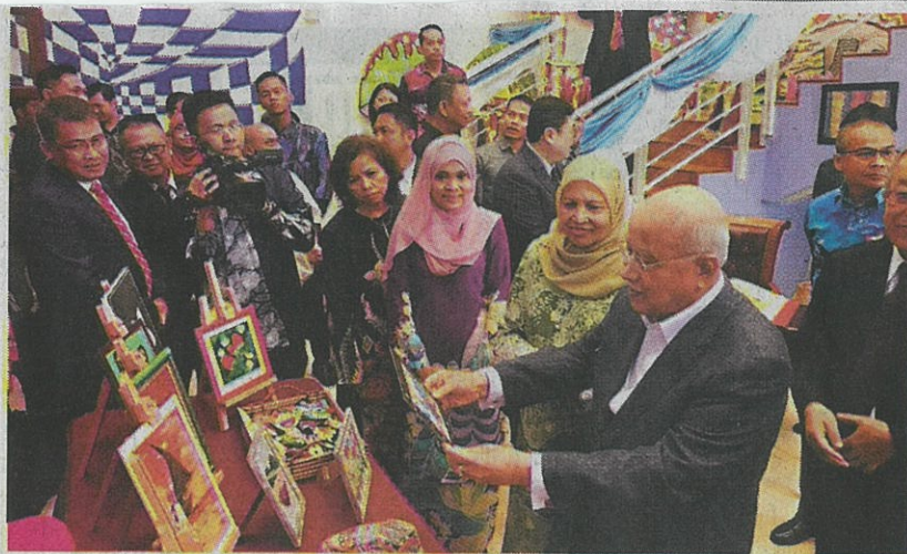
敦阿都拉曼为纳闽国际学校艺术馆主持开幕时观赏学生的艺术作品。