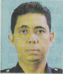
納閩警區主任莫哈末法里警監。